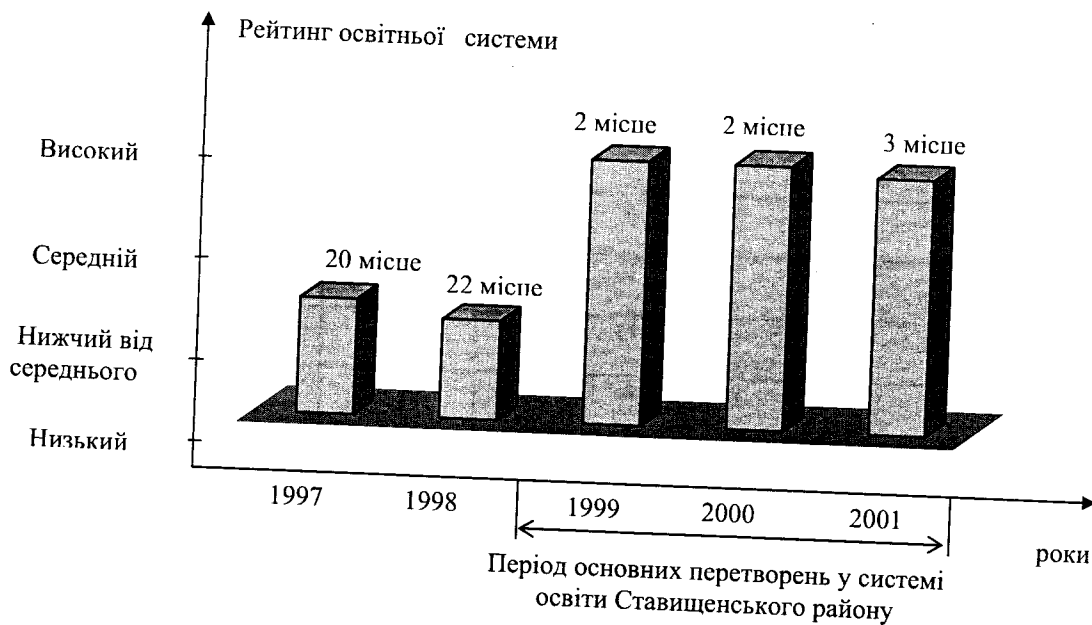
Діаграма 1. Рейтинг освітньої системи Ставищенського району серед освітніх систем Київщини

Для підтвердження ефективності проектно-цільового управління доцільно навести також результати конкретної, тобто цільової діяльності, продемонстрованої освітньою системою Ставищенщини в 2002/2003 навчальному році у сфері позашкільної освіти (табл. 1). Нижче наведено таблицю 3.4 інформаційно-аналітичного збірника за 2002/2003 навчальний рік [265, с.36]. Додатково потрібно пояснити, що позашкільний навчальний заклад у Ставищенському районі — Центр дитячої та юнацької творчості — не обмежувався проведенням роботи на власній базі, а виконував організаційні та координаційні функції у сфері додаткової освіти та суспільного виховання серед усіх загальноосвітніх навчальних закладів району. Саме запровадженням технологій проектної організації діяльності можна пояснити найкращий результат серед 25 сільських регіональних освітніх систем та й більшості міських систем освіти.